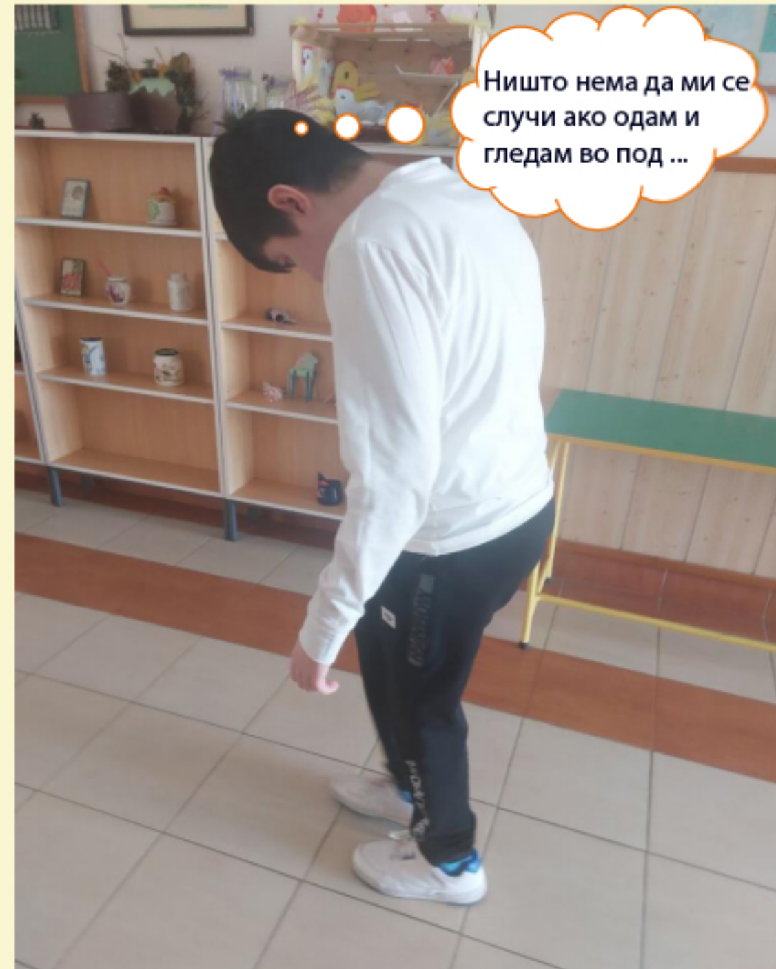
Тино гледа во под додека се движи наместо да гледа пред себе.