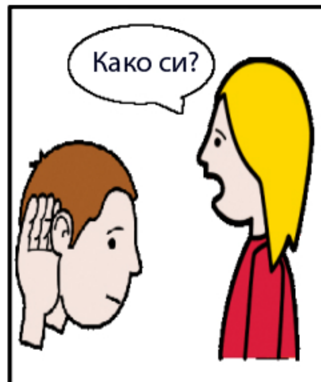
3. Го сослушувам прашањето („Како си?/Што има ново?“).