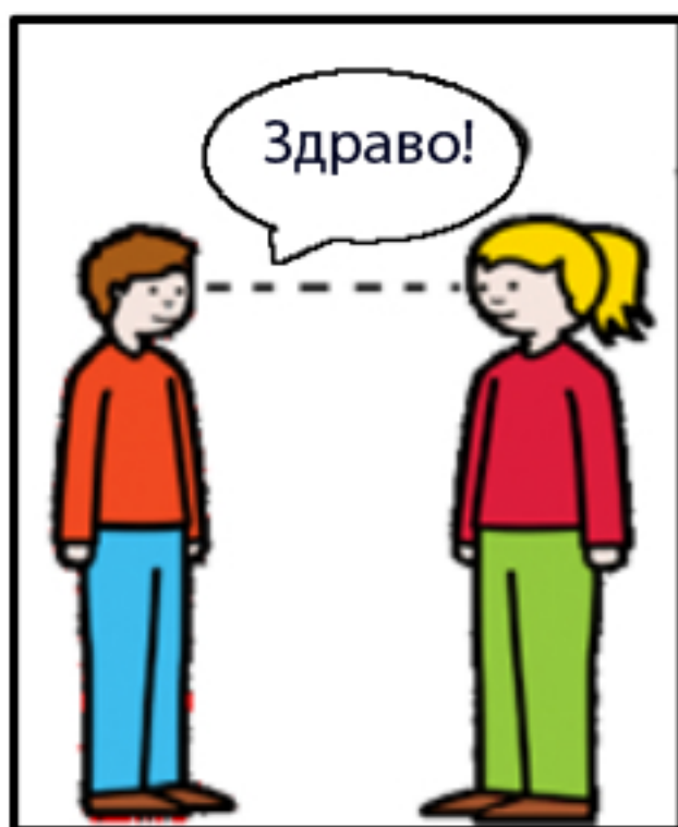
1. Се вртам кон неа и ја погледнувам.

Кога ќе ме поздрават личност која ја познавам: