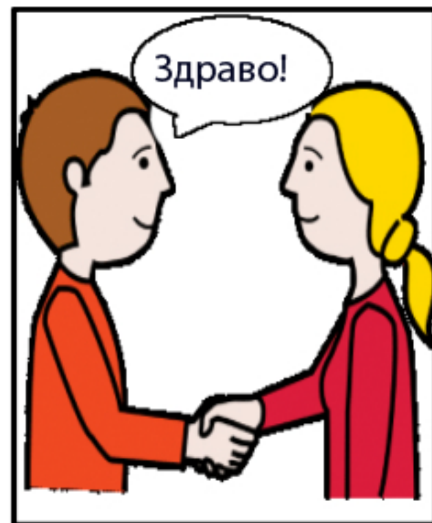
2. И го кажувам поздравот и и и и пружам рака.