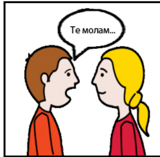
2. Ќе побарам што ми е потребно.