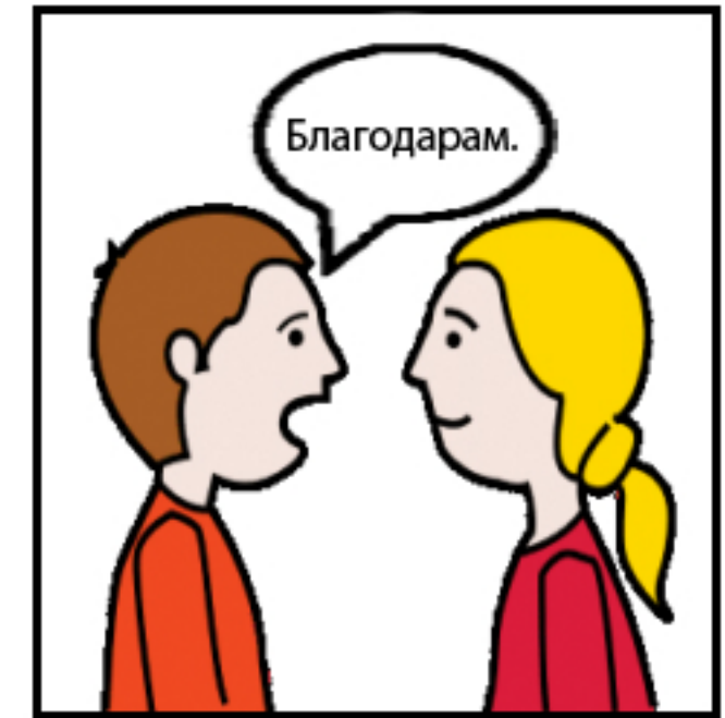
4. Кажувам „Благодарам“ и се насмевнувам.